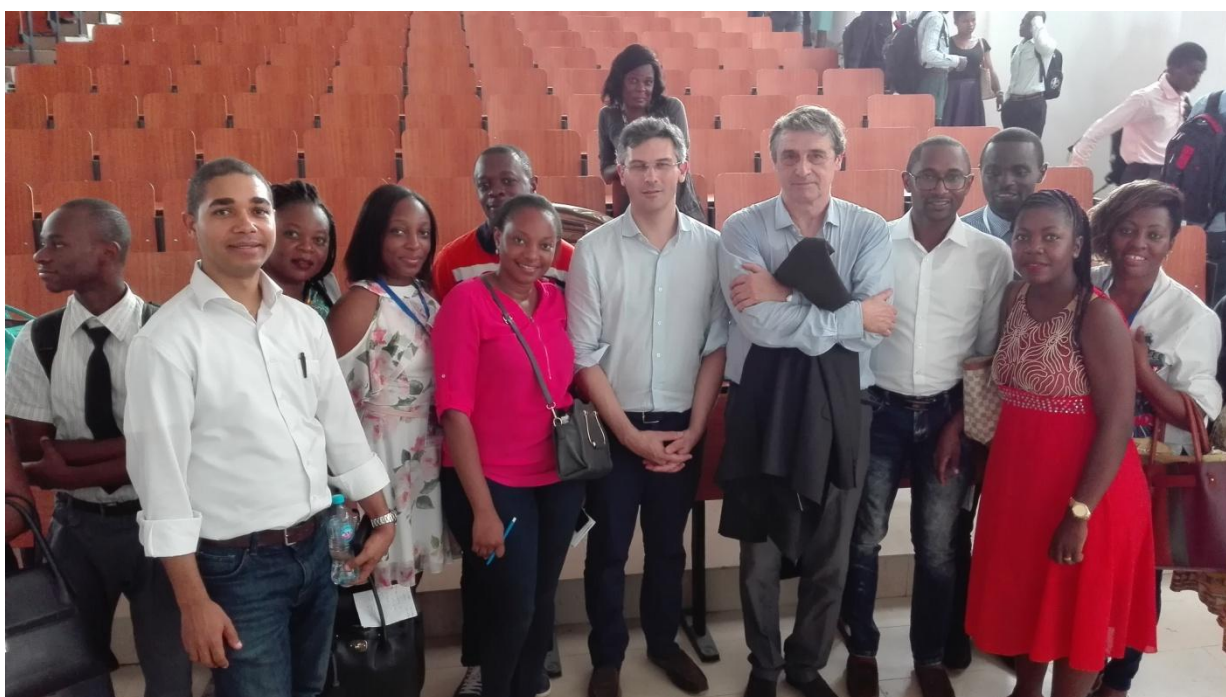
Avec les étudiants en année de Thèse de médecine de la faculté de Douala.