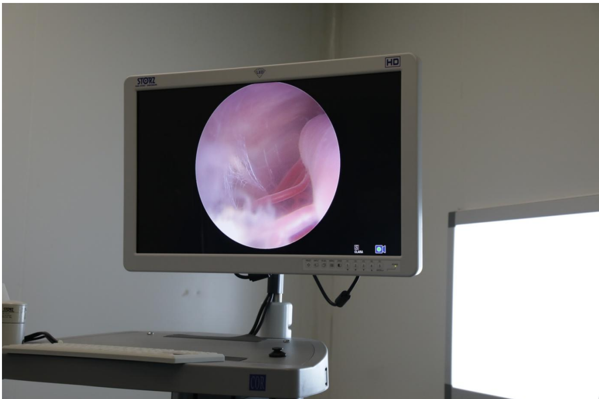
Vue endoscopique du cerveau