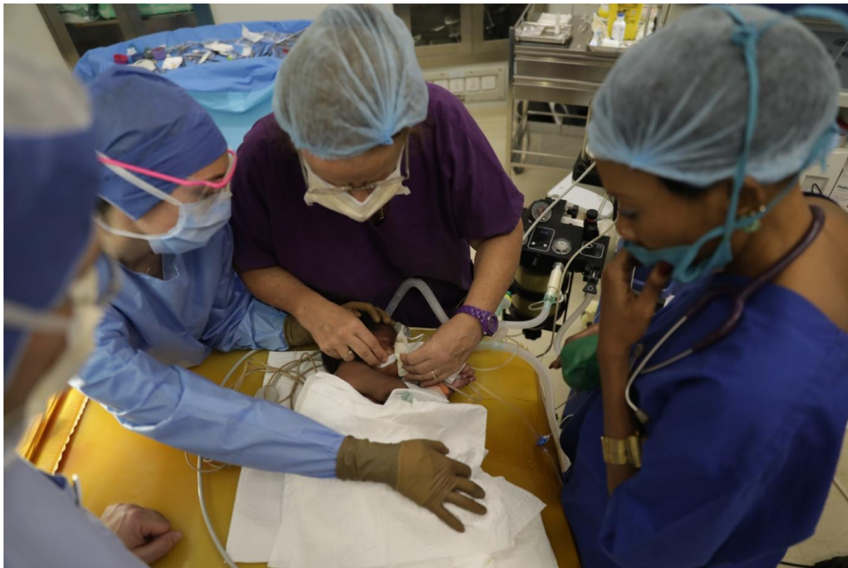
Equipe d'anesthésistes au travail