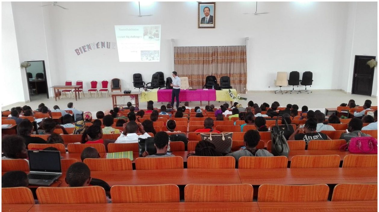
Cours aux étudiants en médecine dans le grand amphithéâtre