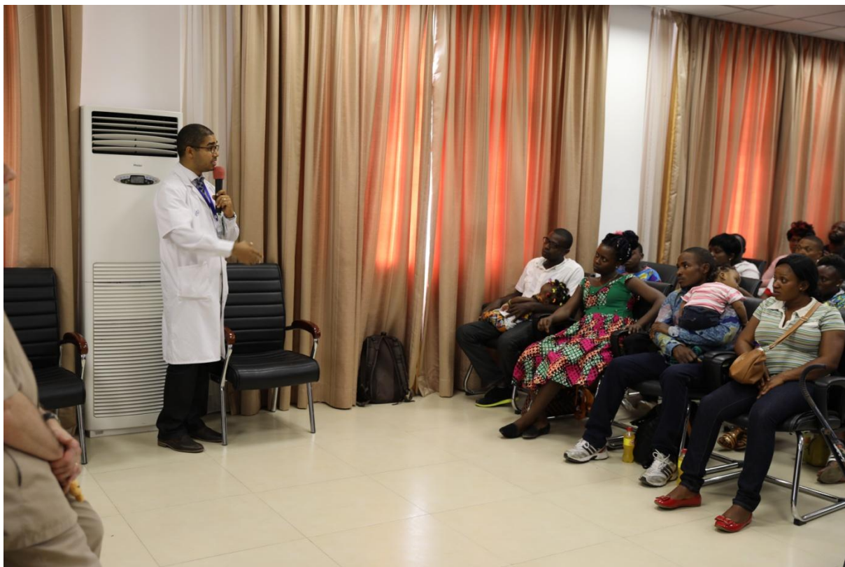
Echanges avec les familles d'enfants malades