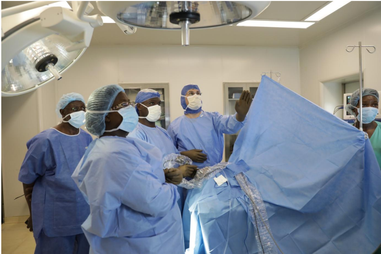
Equipe chirurgicale en cours d'intervention