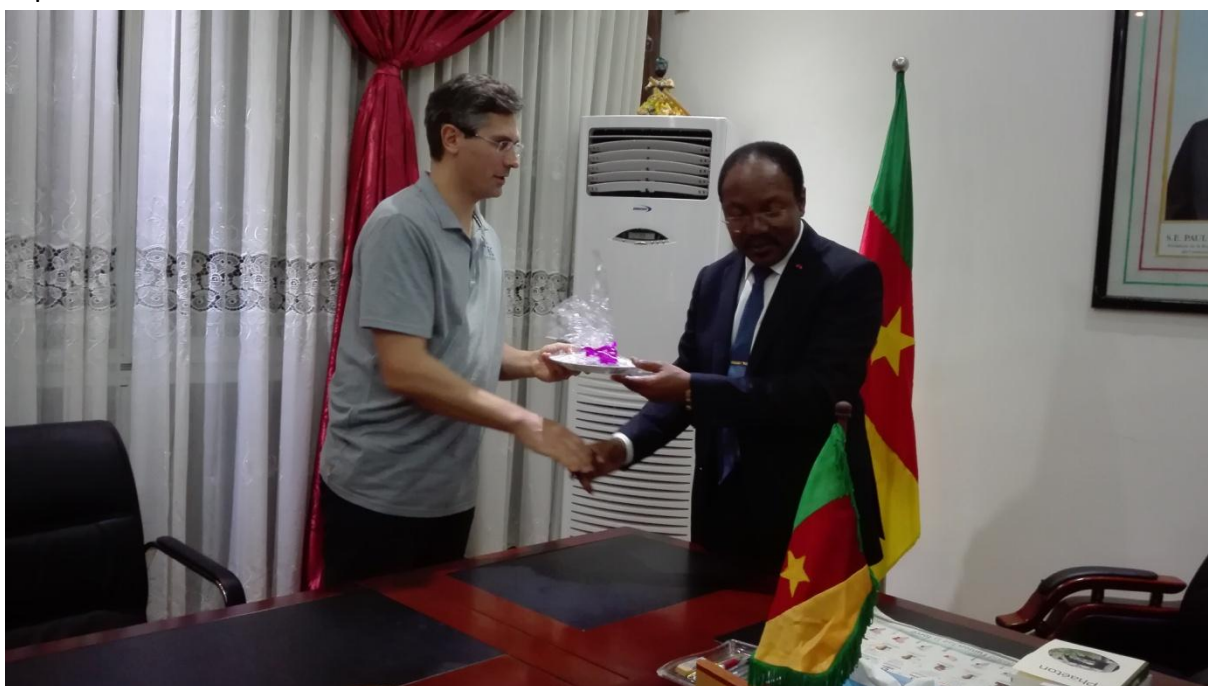
Remise de cadeau à la délégation bordelaise par Monsieur le Délégué du Gouvernement auprès de la Communauté Urbaine de Douala

Plus tard, en fin d'après-midi, rencontre avec Monsieur le Délégué du gouvernement auprès de la Communauté Urbaine de Douala.