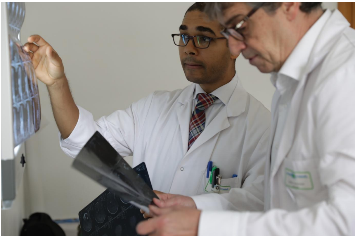
Analyse minutieuse des examens complémentaires