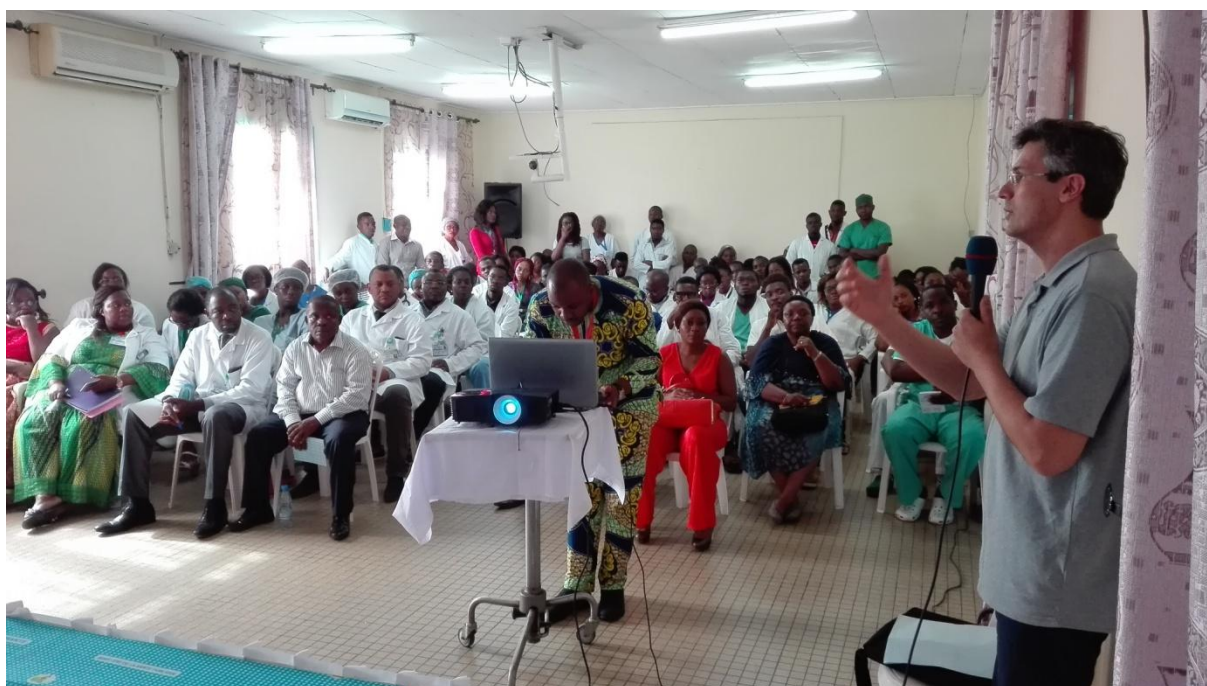
Communication du Pr Jean-Rodolphe VIGNES sur la prise en charge des hydrocéphalies et du spina bifida