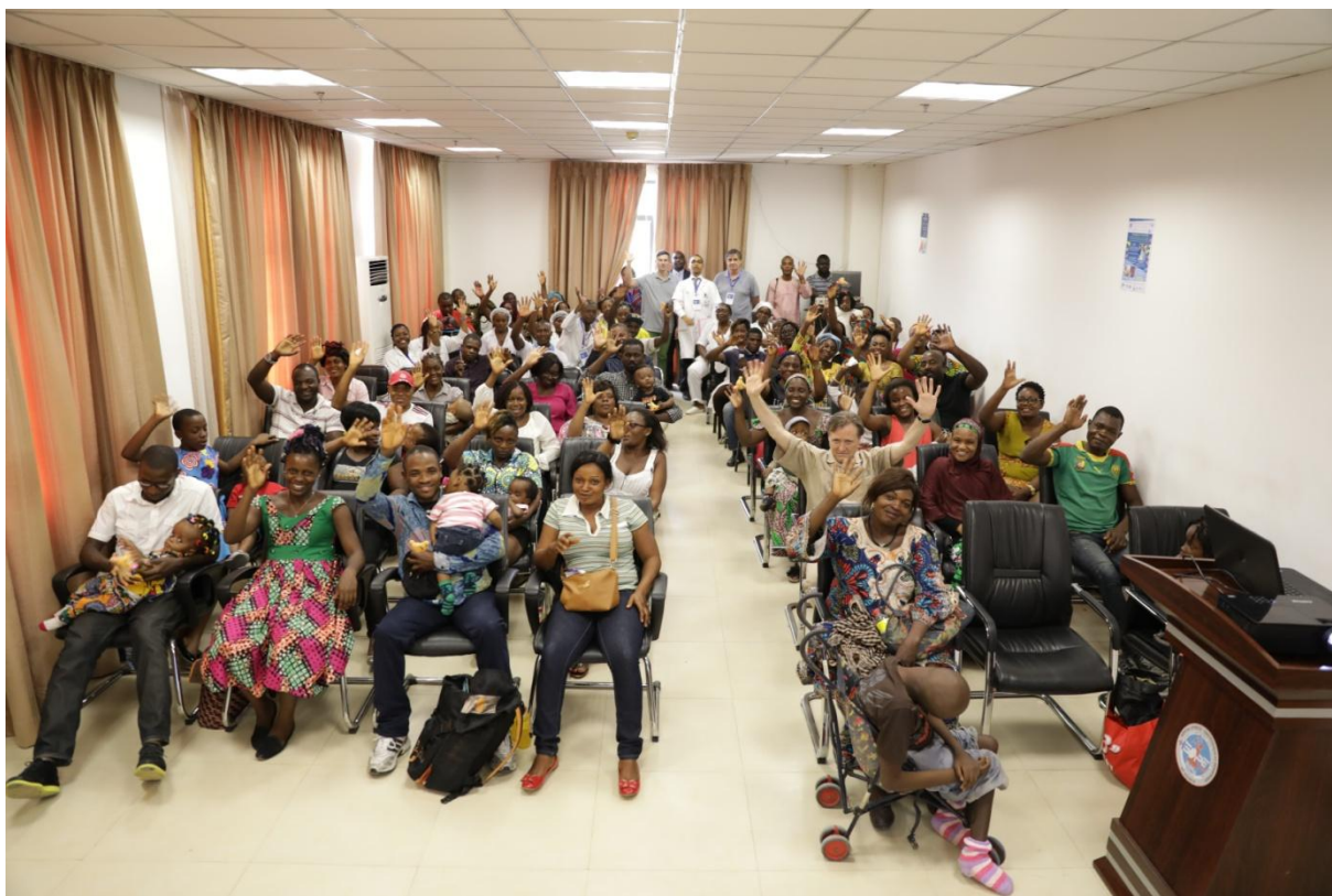
Photo de famille avec les parents d'enfants malades