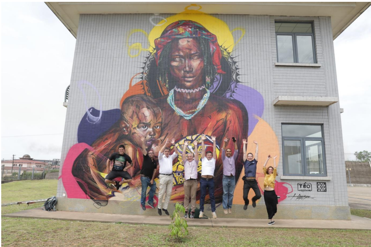
Inauguration de la fresque par l'équipe médicale et artistique